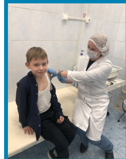
На фото ученик 3 «Б» класса ГБОУ Школы № 618 сегодня поставили прививку от гриппа.

Ученики 3 «Б» класса ГБОУ Школы № 618 сегодня поставили прививку от гриппа.